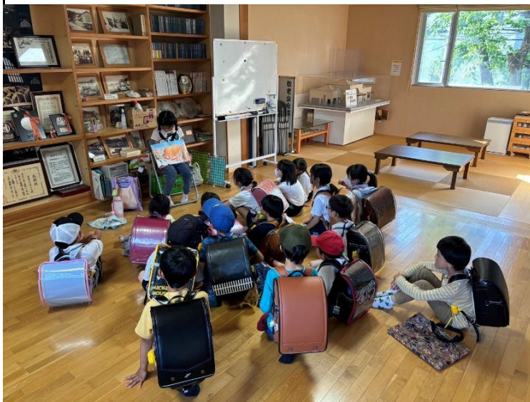
帰宅時、担当の子どもが絵本を読んでいます