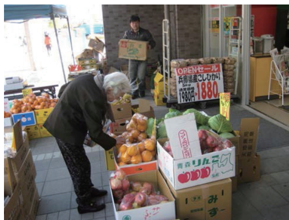
新たに誘致したコンビニの様子

「高齢者の閉じこもり」という福祉課題だけにとらわれず、福祉の視点を持って「まちづくり」を考えたことで、高齢者に配慮された新しい店舗の誘致という最良の結果につながった。