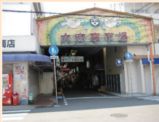
吾妻地区大安亭市場

中央区では平成23年度から地域福祉ネットワーク事業を開始したが、その初年度に吾妻地区をモデル地区に指定。地域で気軽に相談できる場として『何でもいうてや』と名付けた相談窓口のほか、そこに寄せられた様々な課題を解決するために定期的に地域福祉ネットワーク会議を開催している。