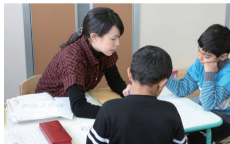
「はいず」での学習の様子

『はいず』には同じルーツを持つ友達がいる、同じ言葉で話せる大人がいるということで、子ども達は週1回『はいず』に通うのを楽しみにしている。