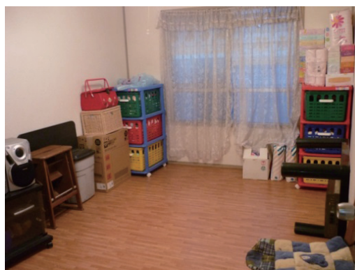
女性の自宅(片付け後)

参考文献：岸恵美子著「ルボ ゴミ屋敷に棲む人々孤立死を呼ぶ『セルフネグレクト』の実態」(幻冬舎)