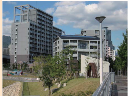
災害復興住宅HAT脇の浜

HAT脇の浜は街の西側に位置し、東西に走る道路の北側の災害復興住宅と南側の分譲住宅などからなる。また、中央には高齢者福祉施設が配置されている。