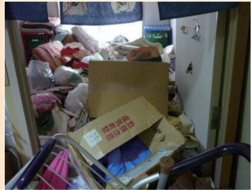
女性の自宅(片付け前)