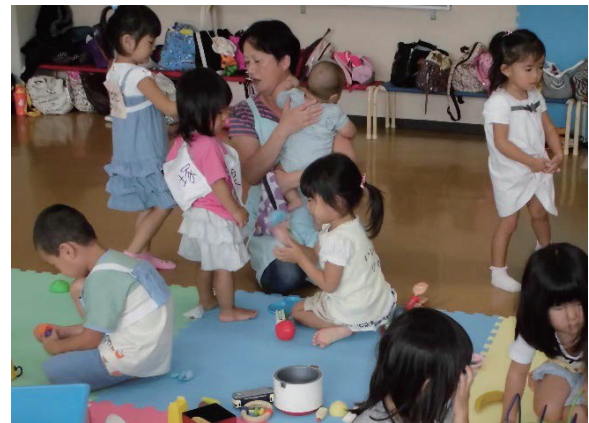
児童館での活動の様子(イメージ)